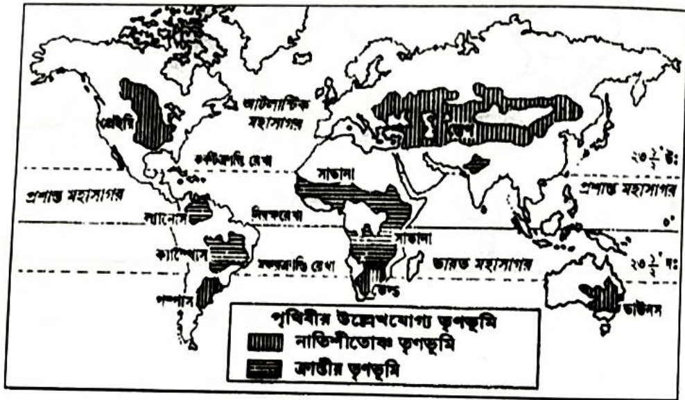
চিত্র : পৃথিবীর তৃণভূমির অঞ্চল

মূলত কম বৃষ্টিপাতযুক্ত অঞ্চলে বিশেষত ক্রান্তীয় ও উপক্রান্তীয় অঞ্চলের তৃণভূমিতে বা মরু অঞ্চলের কাছাকাছি বিস্তীর্ণ উন্মুক্ত তৃণভূমিকে চারণভূমি বলা হয়। এ চারণভূমিতেই পশু চারণ করা হয়। উট, গরু, মহিষ, ছাগল, ভেড়াই প্রধান তৃণভোজী পশু, যাদের পালন করা হয়। এছাড়া মধ্য এশিয়ার উচ্চমালভূমিতে চমরী গাই (ইয়াক), মেরু অঞ্চলে বন্যা হরিণ, কোথাও কোথাও ঘোড়া বা উট ও পালন করা হয়।