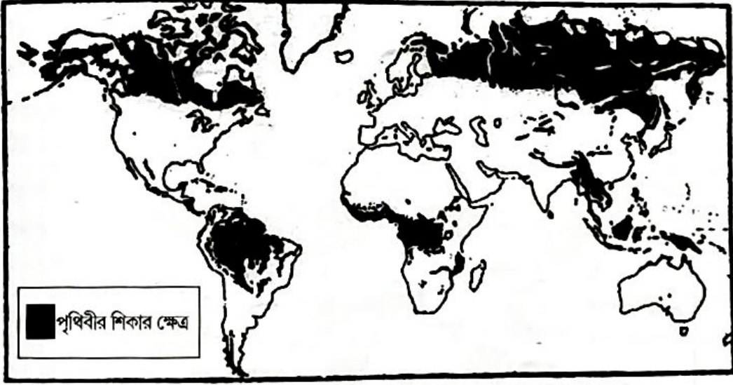
চিত্র : পৃথিবীর শিকার ক্ষেত্র

ক্রান্তীয় অঞ্চলে কিছু উপজাতি বা আদিবাসী আছে যারা শিকার করে জীবনধারণ করে। কারণ এই অঞ্চলগুলি অতিরিক্ত উষ্ণতা (গড় 35°C তাপমাত্রা সারাবছর), বৃষ্টিপাত (গড় 250 সেমি), সারাবছরই আর্দ্রতার কারণে আবহাওয়া অত্যন্ত অস্বস্তিকর। বেশিরভাগ অঞ্চলই ঘন অরণ্যে আবৃত থাকার জন্য বসবাস উপযুক্ত স্থানের অভাব রয়েছে। এখানে এইরকম পরিবেশে তাই কিছু আদিবাসীরাই টিকে রয়েছে যদিও তাদের জীবনযাত্রা একেবারেই আদিম মানুষদের মত। এদের মধ্যে রয়েছে কঙ্গো নদী অববাহিকার পিগমী, মালয়েশিয়ার পার্বত্য অঞ্চলের সাকাই, বোনিওর পুনাম ও সুন্দ দ্বীপের কয়েকটি আদিবাসী সম্প্রদায়। এরা তীর, ধনুক, বর্শা, বনম ইত্যাদি অস্ত্রে বিষ মিশিয়ে বিভিন্ন বন্যপ্রাণী যেমন শূকর, হরিণ, বানর সহ বিভিন্ন ও পাখী নদীর মাছ প্রভৃতি দিয়ে শিকার করে। পরে মাংস লবণে জড়িয়ে রোদে শুকিয়ে ধোঁয়া দিয়ে মাংস সংরক্ষণও করে।